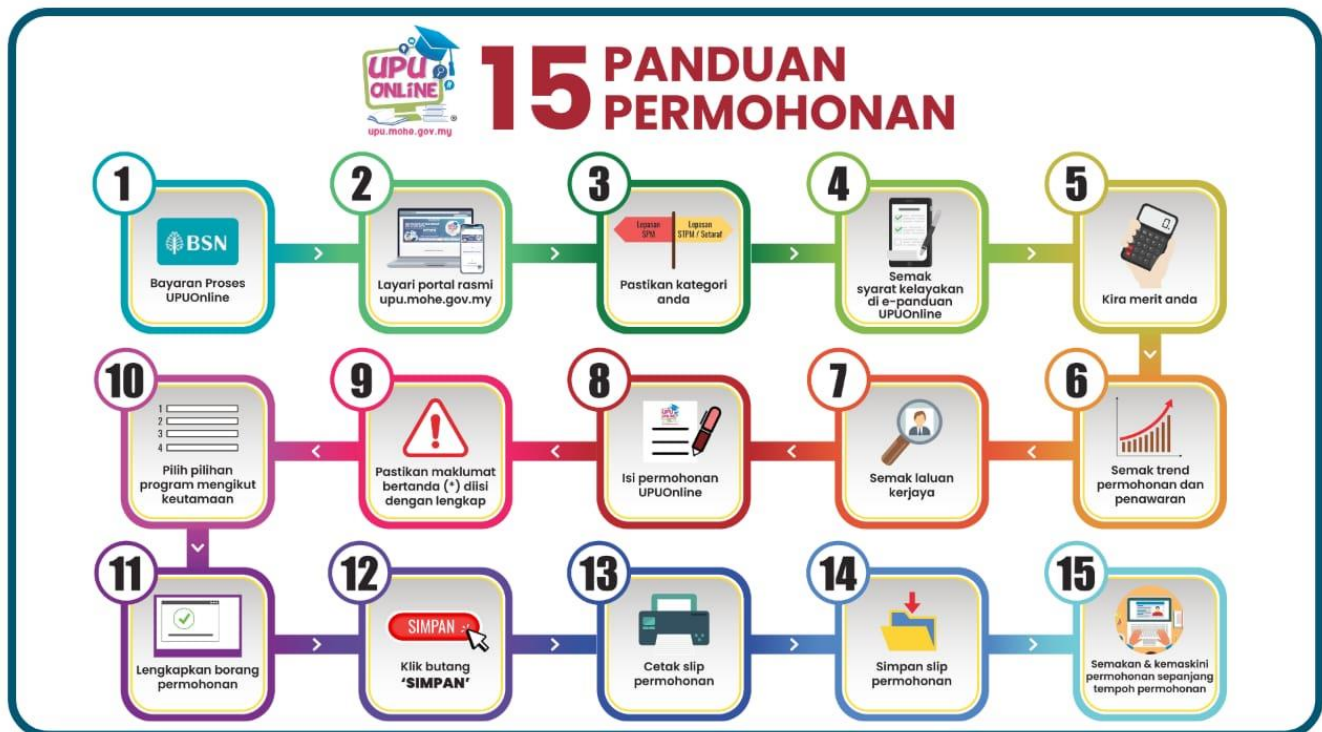
Gambar Rajah 1 : Panduan Permohonan Sesi Akademik 2026/2027

4.3 Calon dinasihatkan membaca terlebih dahulu panduan dan syarat-syarat yang telah ditetapkan bagi mengelakkan calon memilih program yang tidak melepasi syarat khas program pengajian.