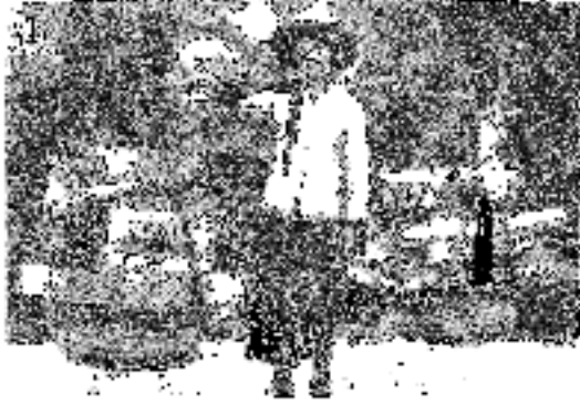
Buruh dari China masuk melalui sistem Mestak

3. Gambar berikut menunjukkan cara kemasukan buruh dari China dan India ( m.s 156-160 ).