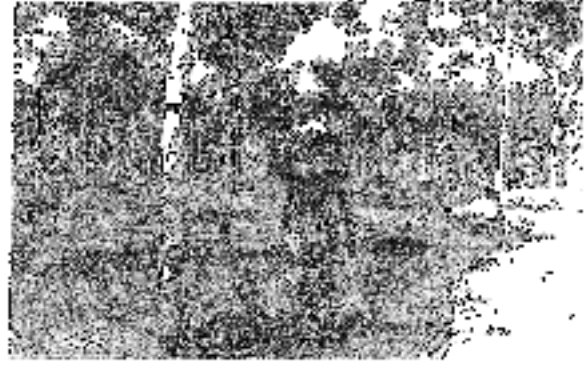
Buruh dari India masuk melalui sistem Kangani