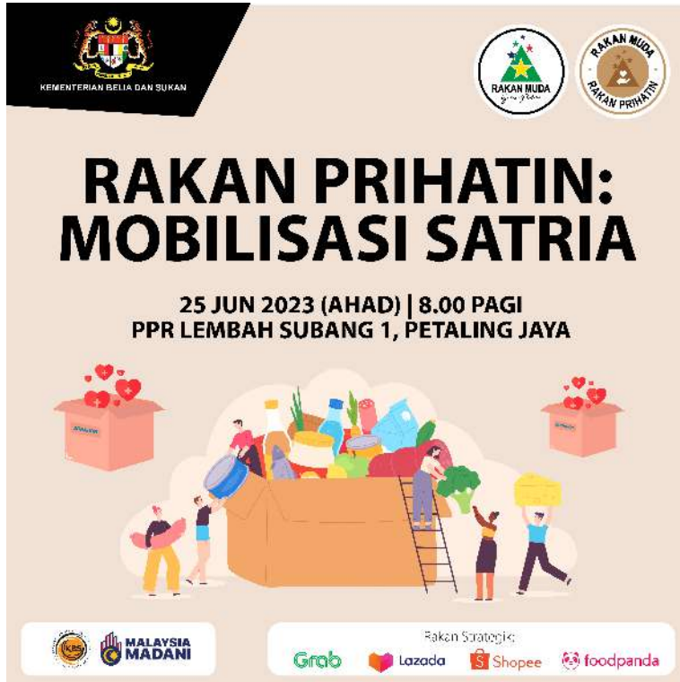
CONTOH 1: PROGRAM ANJURAN KBS DAN JABATAN SERTA AGENSI DI BAWAHNYA *TERTAKLUK KEPADA TATACARA PENGGUNAAN JATA NEGARA