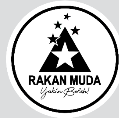
Hitam & Putih

*Hanya untuk latar belakang putih sahaja