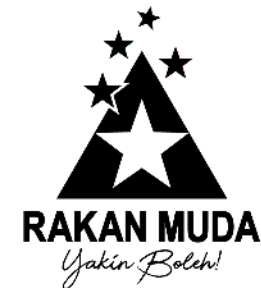
Hitam & Putih