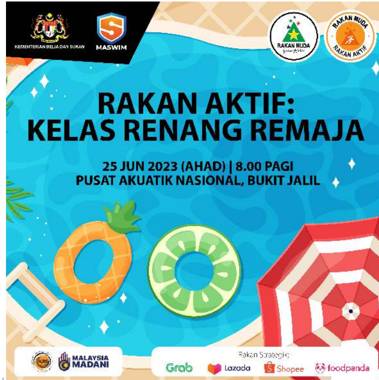
CONTOH 2: PROGRAM ANJURAN KBS DAN JABATAN SERTA AGENSI DI BAWAHNYA DENGAN KERJASAMA RAKAN PELAKSANA *TERTAKLUK KEPADA TATACARA PENGGUNAAN JATA NEGARA