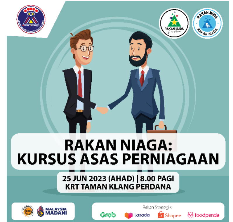
CONTOH 3: PROGRAM ANJURAN RAKAN PELAKSANA TANPA PENGLIBATAN KBS *TERTAKLUK KEPADA TATACARA PENGGUNAAN JATA NEGARA