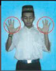
Jari diregangkan terlalu luas