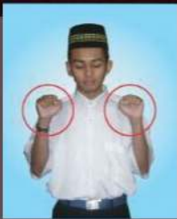
Menggenggam kesemua jari dan jari tidak menghadap langit