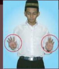
Tangan terlalu rendah