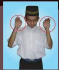
Jari tidak ditegakkan