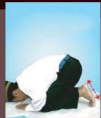
Punggung dan tumit terlalu rapat