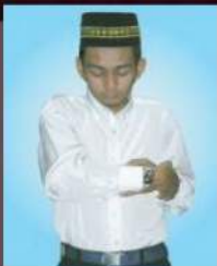
Tangan tidak diletakkan di kawasan dada dan meletakkan tangan di sisi kiri tiada sebarang petunjuk dari hadis