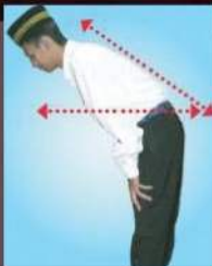
Belakang tidak disamakan dengan kepala