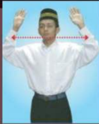
Tangan terlalu tinggi melebihi paras bahu atau telinga