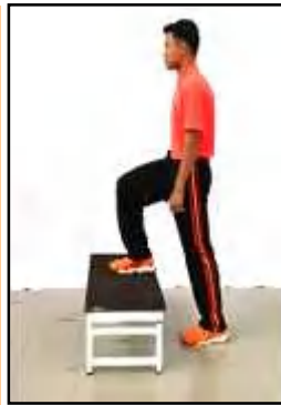
Gambar B Naik Turun Bangku 3 Minit