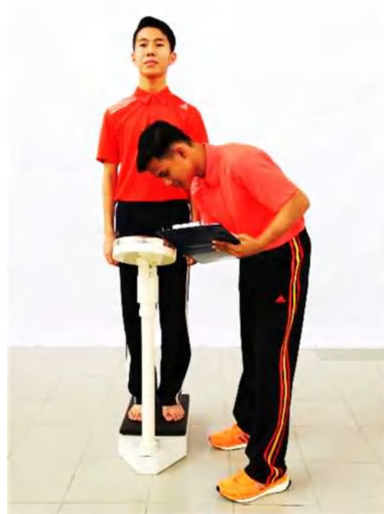
Ilustrasi 2: Mengukur Berat Badan