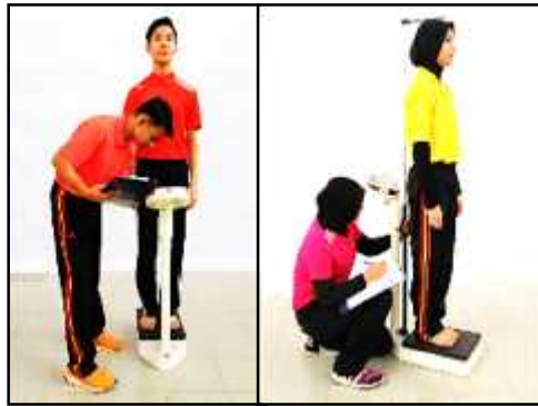
Gambar A Indeks Jisim Badan