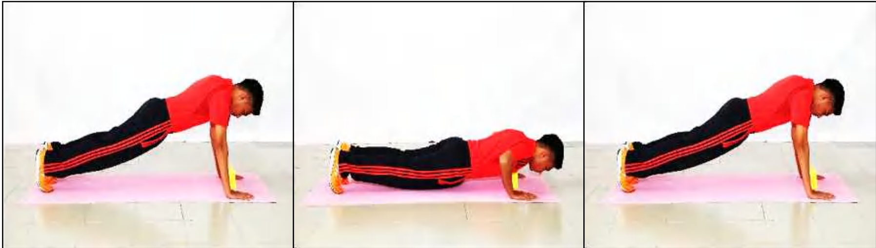
Gambar A - Sokong Hadapan atau Bersedia