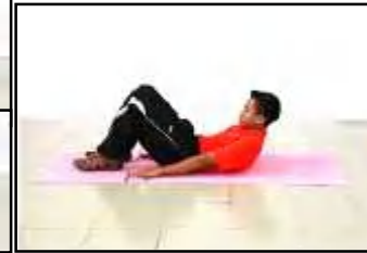
Gambar D Ringkuk Tubi Separa