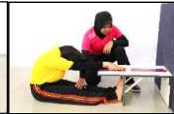
Gambar E Jangkauan Melunjur