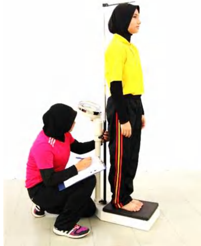
Ilustrasi 3: Mengukur Tinggi