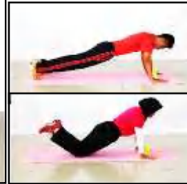
Gambar C Tekan Tubi atau Tekan Tubi Ubah Suai