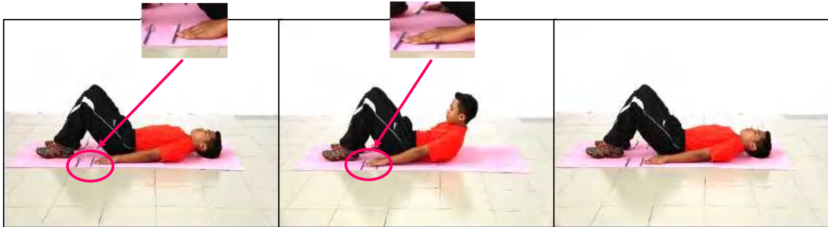
Gambar A - Sedia