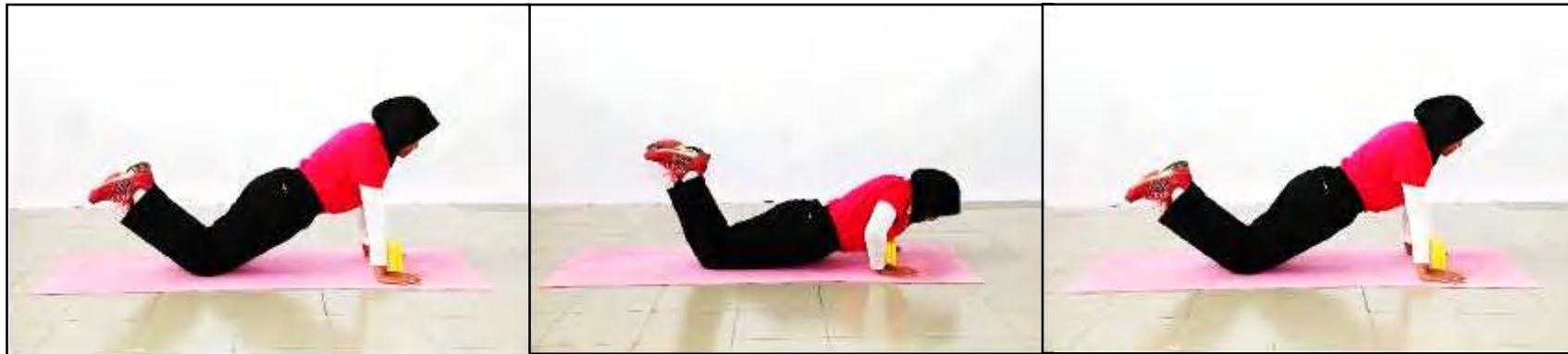
Gambar A - Sokong Hadapan atau Bersedia