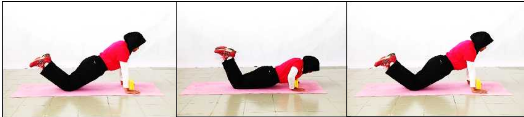
Gambar A - Sokong Hadapan atau Bersedia