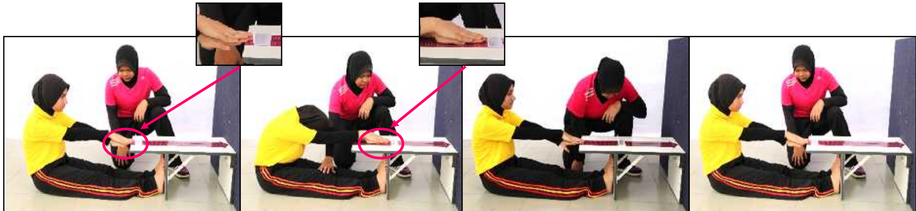
Gambar A - Sedia