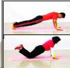
Gambar C Tekan Tubi atau Tekan Tubi Ubah Suai