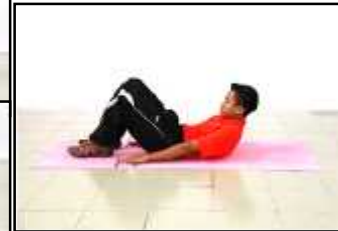
Gambar D Ringkuk Tubi Separa