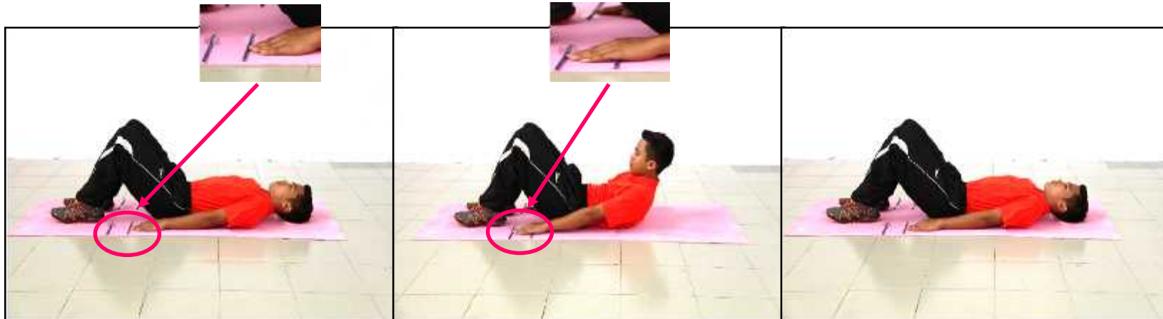
Gambar A - Sedia