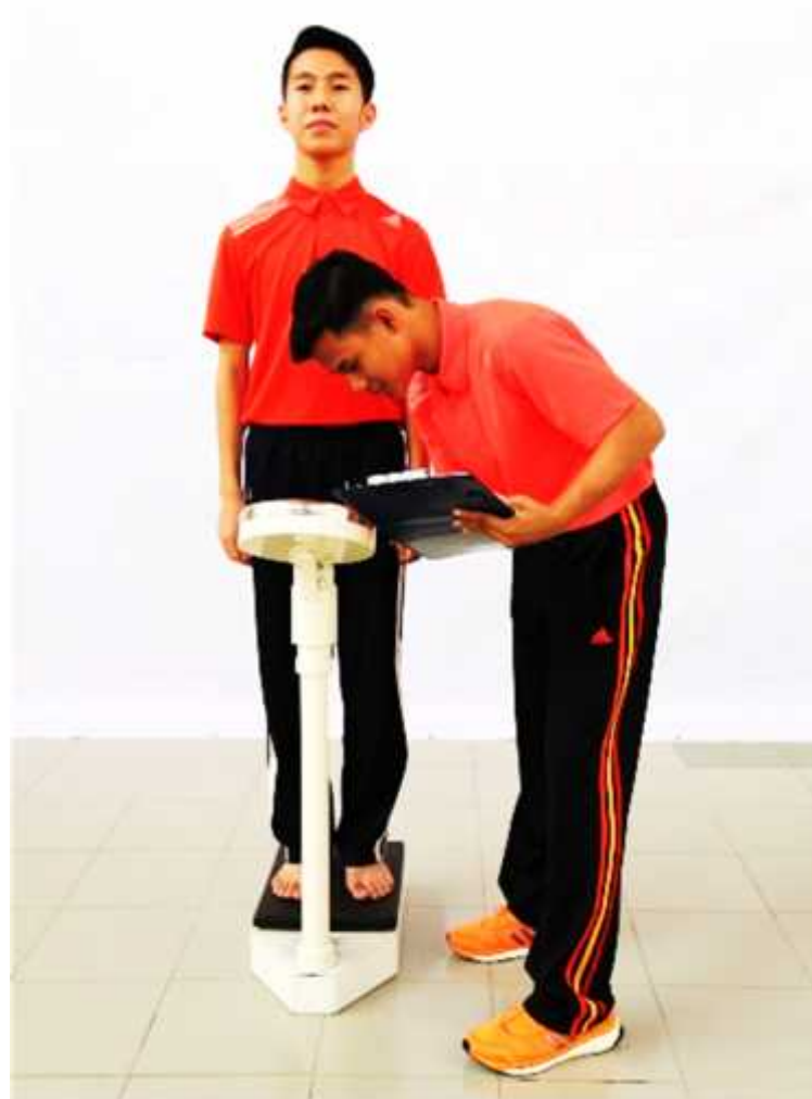
Ilustrasi 2: Mengukur Berat Badan