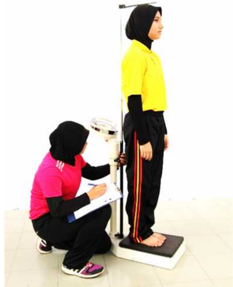
Ilustrasi 3: Mengukur Tinggi