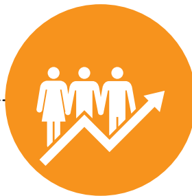
'Kebersamaan' Common Ground